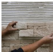
1 - Je pose