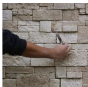
2 - J'élimine le surplus de colle