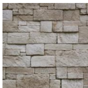
3 - J'hydrofuge

MATERIEL NECESSAIRE : Peigne 9x9x9, truelle, niveau, crayon, seau, malaxeur, colle ORFLEX, disque à matériaux, hydrofuge et pulvérisateur si pose en extérieur.